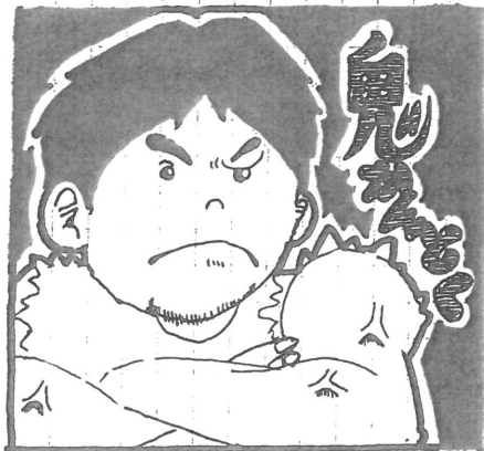
こはらくにズ(くちゃん先生)