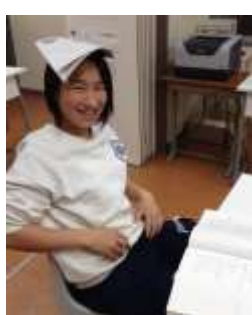
休憩中はおちゃめです(笑)