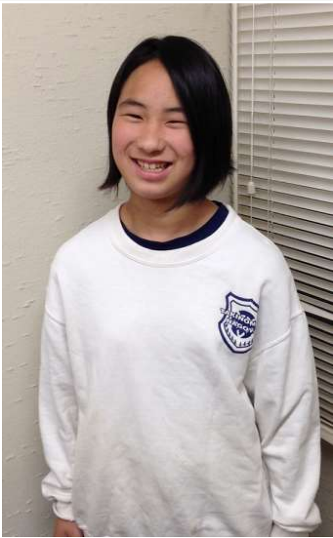
全国大会めざして、がんばってます！