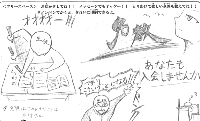
高2 超高校生級の名教生 さん