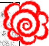
小4の子のノートです。興味を持った時代名を調べました！